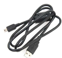
Przewód do transmisji danych mini USB WAPRZUSBMNIB5