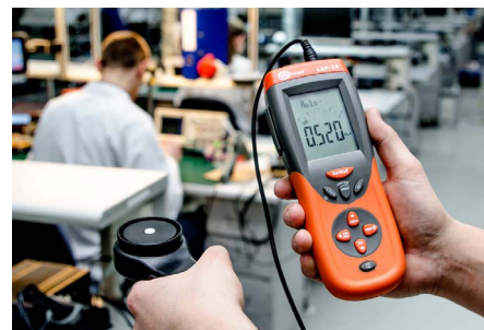
Pomiar na stanowiskach pracy

Model skierowany dla osób wykonujących podstawowe pomiary natężenia oświetlenia miejsc pracy wewnątrz i na zewnątrz. Urządzenie współpracuje z głowicą pomiarową LP-1 (klasa B), pozwalającą na wykonywanie wiarygodnych pomiarów. Niezintegrowana głowica eliminuje wpływ użytkownika na wynik pomiaru.