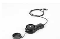
Soda luksomierza LP-10B (do LXP-10B) WAADALP10B